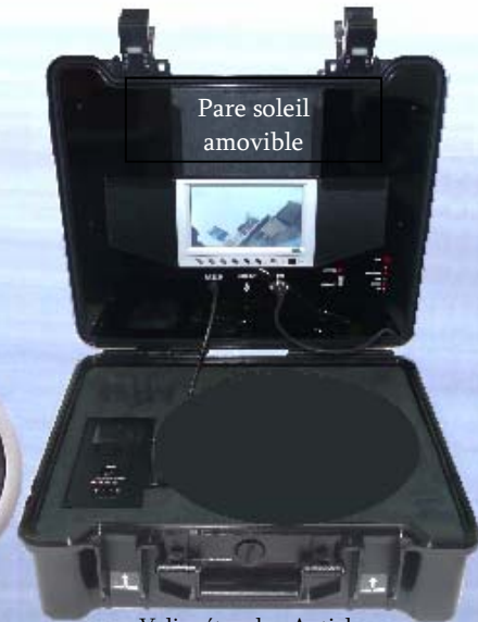
Valise étanche, Antichoc Fermeture sécurisée.